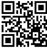
BCPへの取り組み動画