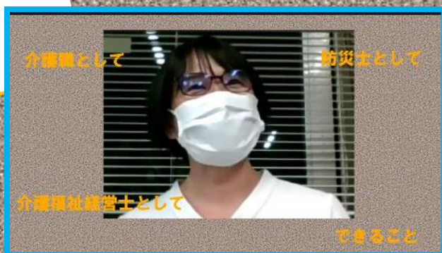
訪問看護BCPサポート動画